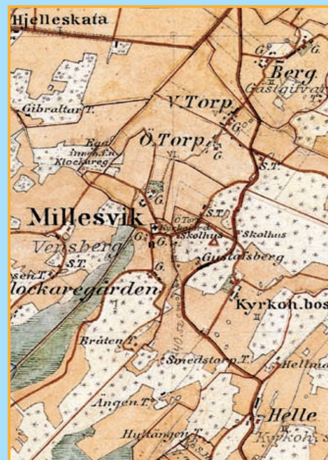
Detalj av konceptblad till ekonomisk karta, uppmätt 1883-1895. Kyrkoherdebostället ligger sydost om kyrkan.