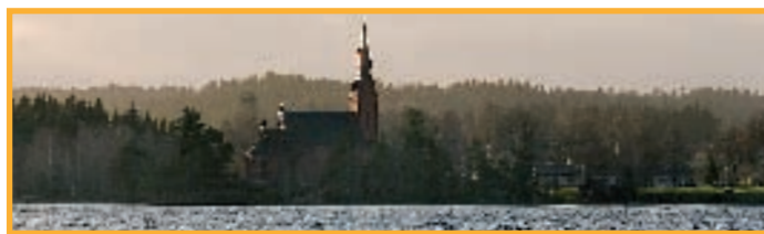
Den 25 januari 1225 passerade norske kungen Hákon Hákonsson Ny kyrka med sin krigshär på flera tusen man. Från Kongsvinger följde man sjösystemens isar över Eda ner mot Arvika, Älgå och Glava.

Kulturspridningen följde människornas vägval på vatten och land. Samma väg kom också kristendomen. Kyrksöckerna uppträder från 1200-talet som pärlor på de trådar som kommunikationslederna utgör.